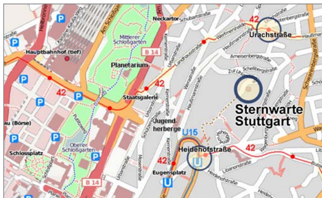
Vi.S.d.P.: Schwäbische Sternwarte e.V., Zur Uhlandshöhe 41, 70188 Stuttgart

Die Sternwarte (zur Uhlandshöhe 41, 70188 Stuttgart) ist mit der Stadtbahn U15, Haltestelle Heidehofstraße, oder mit der Buslinie 42 über die Haltestellen Urachstraße und Heidehofstraße erreichbar.